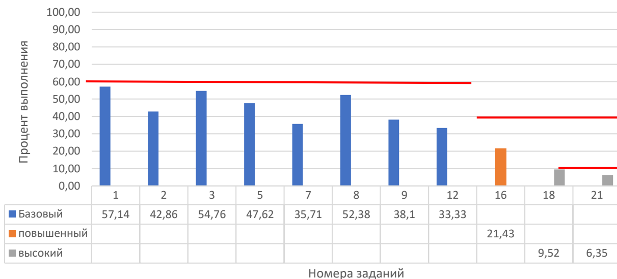
Рисунок 2. Задания, по которым участники не преодолели минимальный порог

Анализ результатов участников и типов заданий, попавших в перечень (табл. 2, рис. 2), выявил следующие частые затруднения участников экзамена: